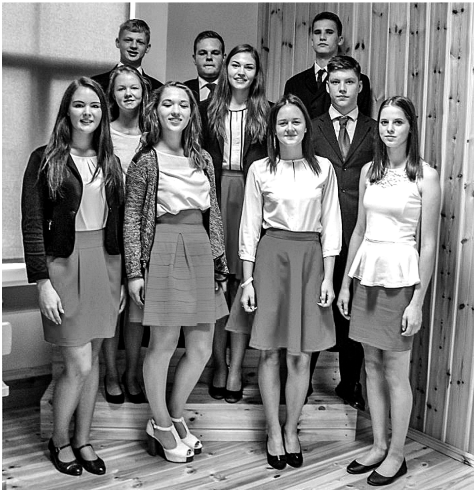
Jaunais skolēnu parlaments.