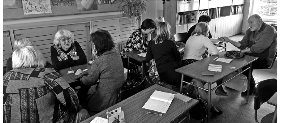
Skolotāju debates seminārā „Stāstu stāstiem izstāstīju”.

Pirmsskolas un 1.-4. klases skolēni 9. septembrī noskatījās leļļu teātra izrādi par pilēnu Timu.