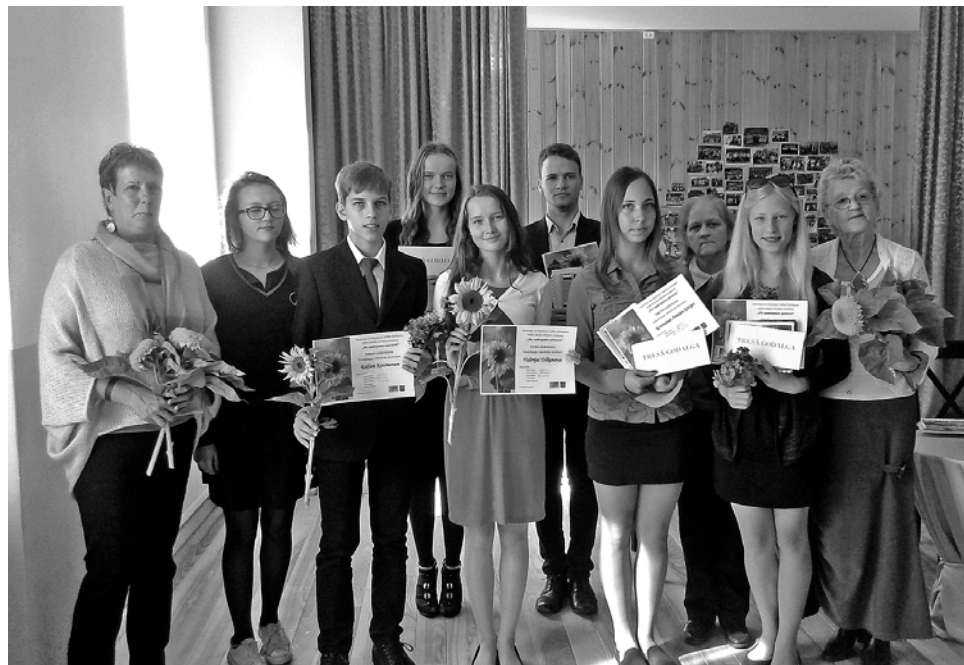
Konkursa literāti kopā ar žūriju.