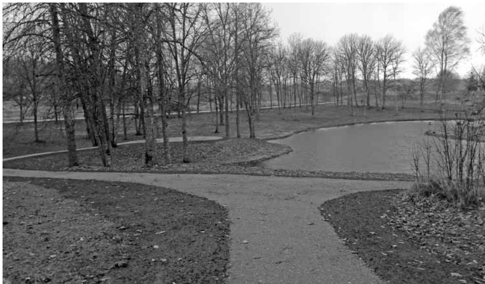
Muižas parkā izveidotas jaunas pastaigu takas.

Blakus ģerbonim, kas veidots no augiem un uzdzieds katru gadu no jauna, vienas celiņi ar soliņiem atpūtai. Daudzdzīvokļu māju iemītnieki ceļu uz veikalu vai pieturu tagad var baudīt kā pastaigu. Nenoliedzami jauns un patīkams ieguvums mazajiem iedzīvotājiem ir izveidotais rotaļu laukums. Tas atrodas netālu no daudzdzīvokļu mājām un netālu no pamatskolas. Laukumu gan vēl nevar izmantot, jo tas nav nodots ekspluatācijā. Vēl pavisam nedaudz pacietības, un rotaļu laukumā bērni interesantās atrakcijās varēs aktīvi pavadīt brīvo laiku. Paldies par ieguldīto darbu, laiku, izdomu un izpildījumu visiem, kuri piedalījās pārvērtībās! Pacieļojiet un ieraugiet, cik skaista top Dzērbenē!”