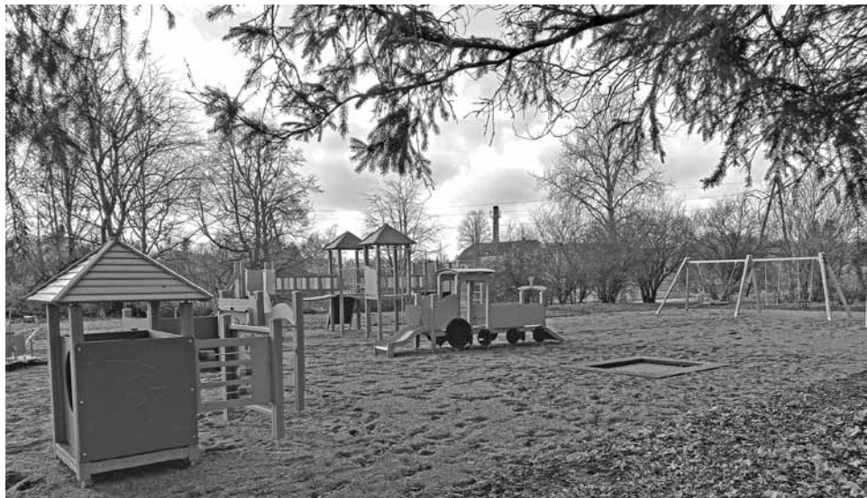
Bērnu rotaļu laukums.

Pagasta pakalpojumu centra speciāliste Edīte Amane pauž gandarījumu par jauniem apskates objektiem un izklaides iespējām Dzērbenē: „Ar katru gadu plašāks top piedāvājums gan tūristiem, gan pašmāju ļaudīm brīvajiem brīžiem. Šis rudens mums ir bijis ļoti bagāts - muižas parkā izveidotas jaunas pastaigu takas, kas ved no pils uz “Mīlestības saliņu”, no jauna tapis skvērs Dzērbenes centrā.