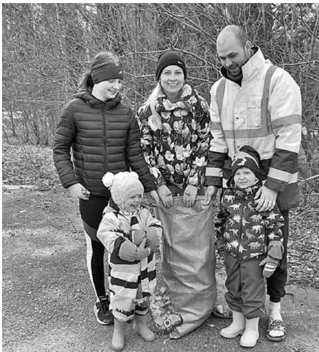
Engeru ģimene talkā Inešos.