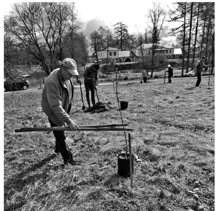
Vecpiebalgas muižas augludārza atjaunošana Lielās Talkas laikā.