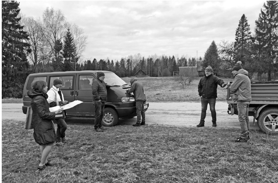
Pašvaldības speciālisti un būvnieki apspriež autoceļa B21 "Stacija-Brodi-Kaupēni-Teikmaņi" pārbūves darbus.

EIROPAS SAVIENĪBA EIROPA INVESTĒ LAUKU APVIDOS Eiropas Lauksaimniecības fonds lauku attīstībai