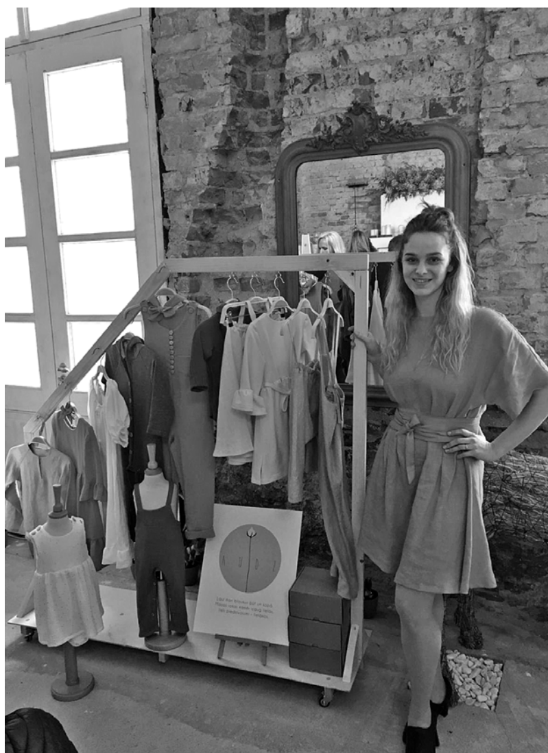
Madara konkursa finālā Jelgavā.

un logo. Galvenais, protams, ir jau 12 gatavās produktu vienības, kuras gaida brīdi, kad tiks piedāvātas iegādei.