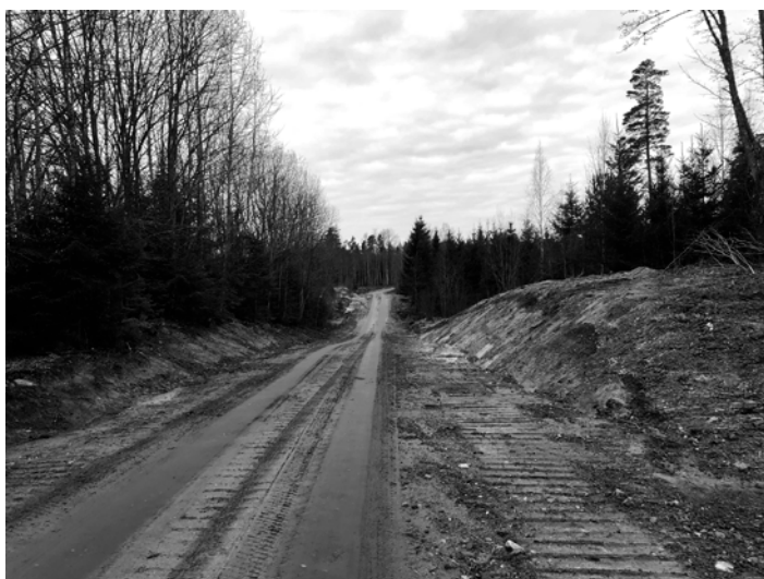
Remontdarbi uz pašvaldības autoceļa B74 "Brežģis – Runtis".