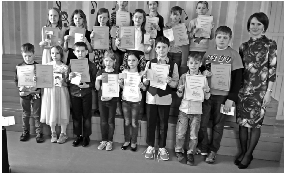
Zīmēšanas konkursa “Mana dziesma” laureāti.

Apkārtnes sakopšanas talka . Katrs pavasaris atnāk ar pirmajām puķēm, plaukstošiem zariem un putnu treļļiem. Taču, nokūstot sniegam, atklājas ziemas noslēptie neglītumi. Sestdien, 21. aprīlī, skolas darbinieki, skolēni un viņu vecāki pulcējās talkai. Vecāki izzāģēja krūmus, kopā ar bērniem grāba lapas, nesa zarus, slaucīja celiņus. Darbs ritēja ļoti veikli, un pēc pāris stundām gan sporta laukums, gan skolas apkārtnē bija sakopta. Paldies čaklajiem talciniekiem!