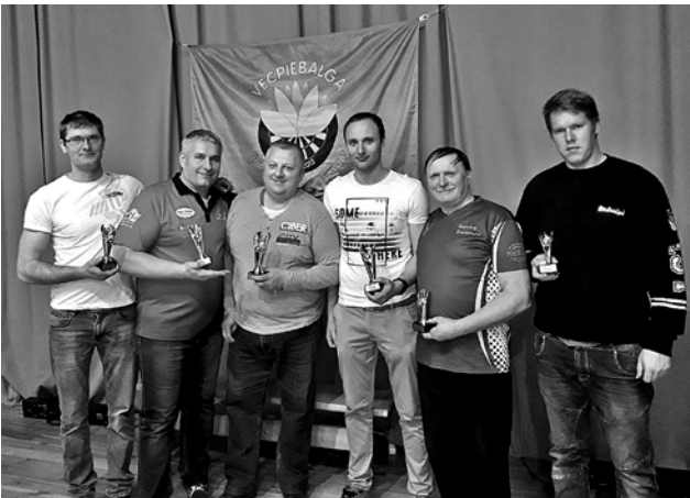
Lieldienu kausa uzvarētāji.