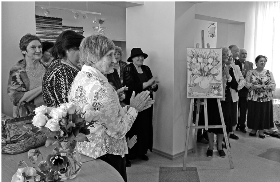
Izstādes atklāšanas pasākums Dzērbenē.

Ar šiem skaļajiem vārdiem plaukst pavasaris un Dzērbenes pils visus aicina uz 10. amatnieku un mākslinieku radošo darbu izstādi, kas skatāma no 13. aprīļa līdz 1. jūnijam.