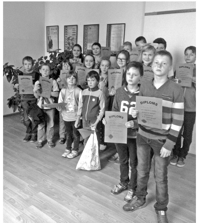
Skrējiens „Apkārt Dzērbenei” uzvarētāji.