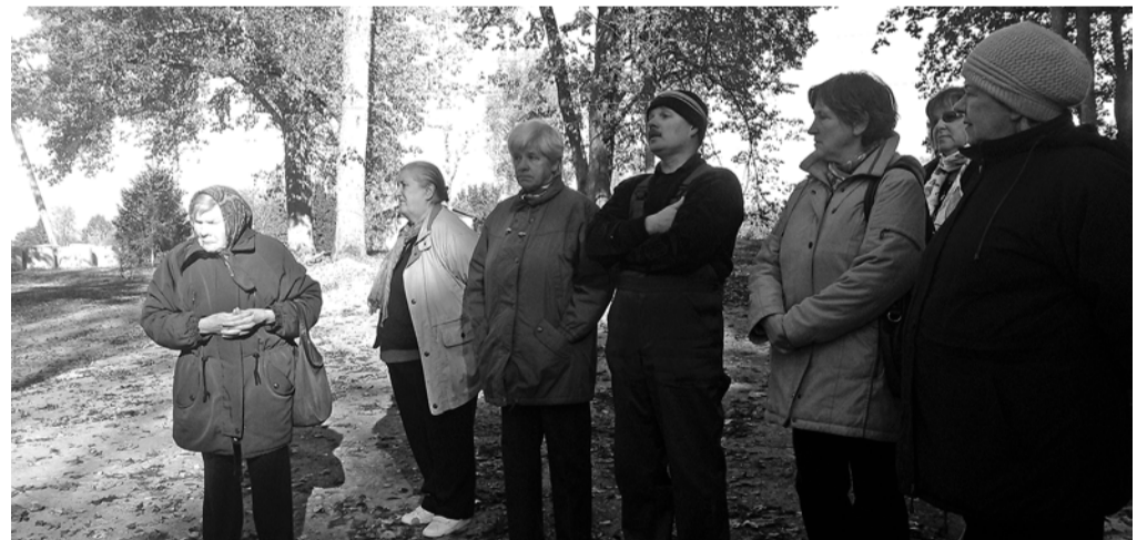
Pensionāri bijušās Taurenē skolas, tagad sporta bāzes, pagalmā.

Pirms irsties sporta bāzē, devāmies uz skatu laukumu Zaļkalnā. Visus iepriecināja paveiktais ceļu būvniecībā. Pirmais, ko ievērojām, ka skaisti izceļas aleja, kas ved uz veco skolu - sporta bāzi, jo visapkārt izcirsti krūmi un lielā mērā sakārtota visa apkārtnē. Ar šo darbību sevi pietiecis