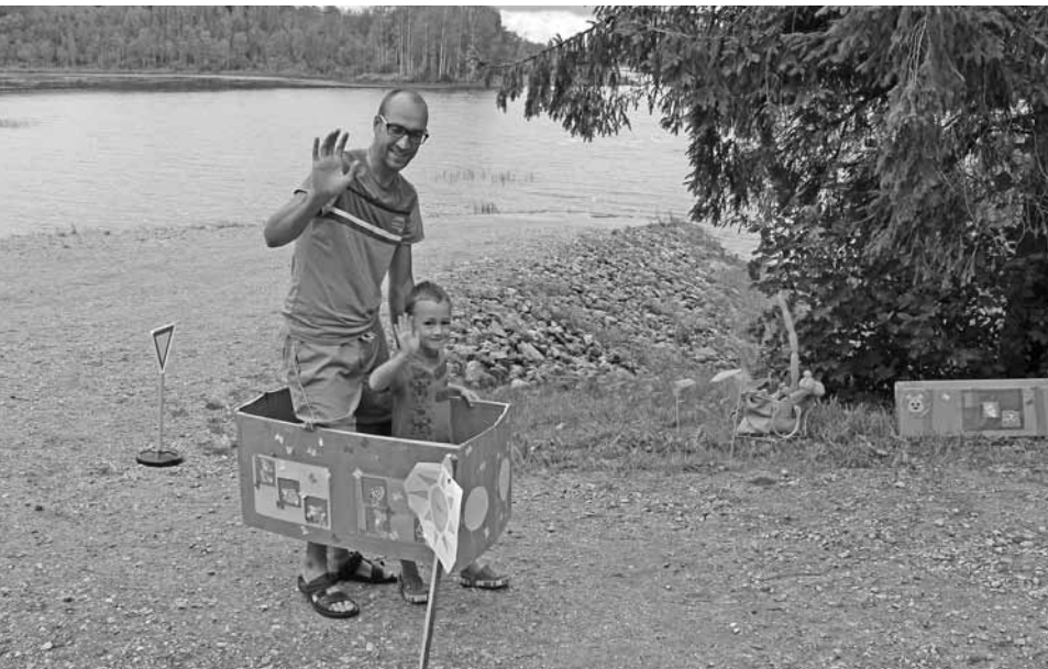
Alauksta krastu piektdienas rīta pusē pieskandināja pirmsskolēnu sporta svētku dalībnieku gaviles.