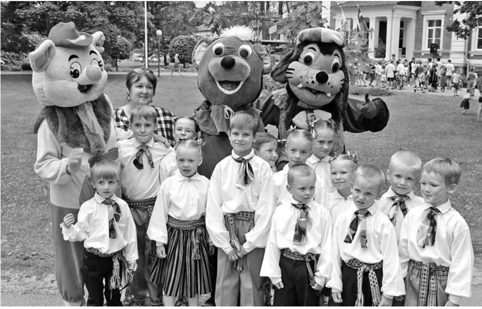
Ģimeņu pēcpusdienā Nēķena muižas parkā bērni koncertēja un kopā ar pasaku varoņiem iesaistījās dažādās izklaidēs un atrakcijās. Inešu pamatskolas dejotāji un izrādes "Medus rausis" varoņi.