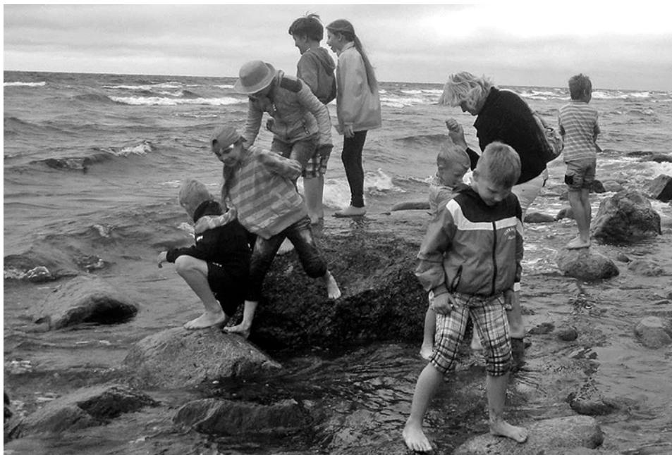
Skujenieši Vidzemes jūrmalā.