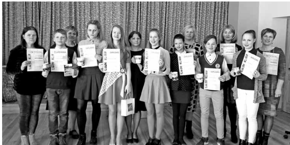
Amatas, Jaunpiebalgas, Līgatnes, Pārgaujas, Priekuļu, Raunas un Vecpiebalgas novada izglītības iestāžu pētniecisko darbu konkursa dalībnieki un pedagogi.

22. martā notika matemātikas konkurss „Ķengurs - 2018”.