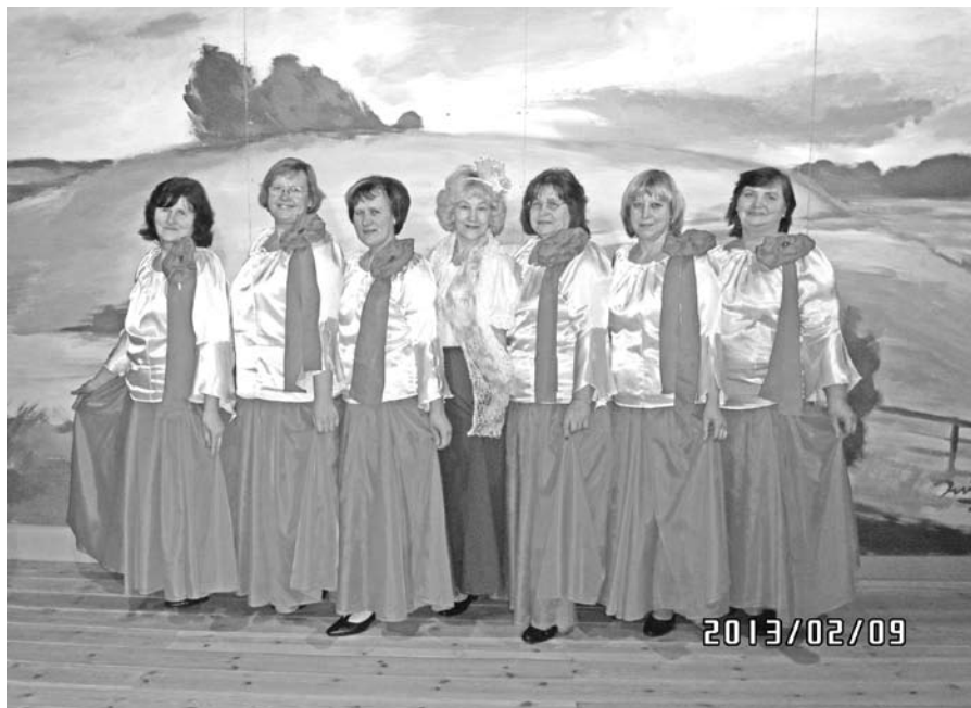
Vecpiebalgas novadu konkursā pārstāvēja Inešu, Kaives un Taurenes (attēlā) dāmu deju grupas.