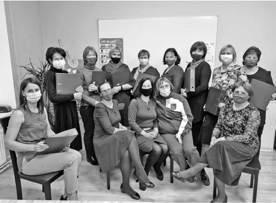
Arī pedagogi Krāsu nedēļā solidarizējās ar skolēniem. Šoreiz zilās krāsas diena.