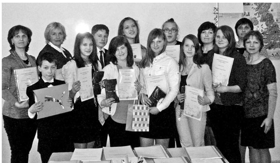
Jaunie pētnieki un skolotājas Vecpiebalgas vidusskolā.

17. aprīlī Vecpiebalgas vidusskolā 7. reizi norisinājās Atklātais pētniecisko darbu konkurss 5.-9. klašu skolēniem.