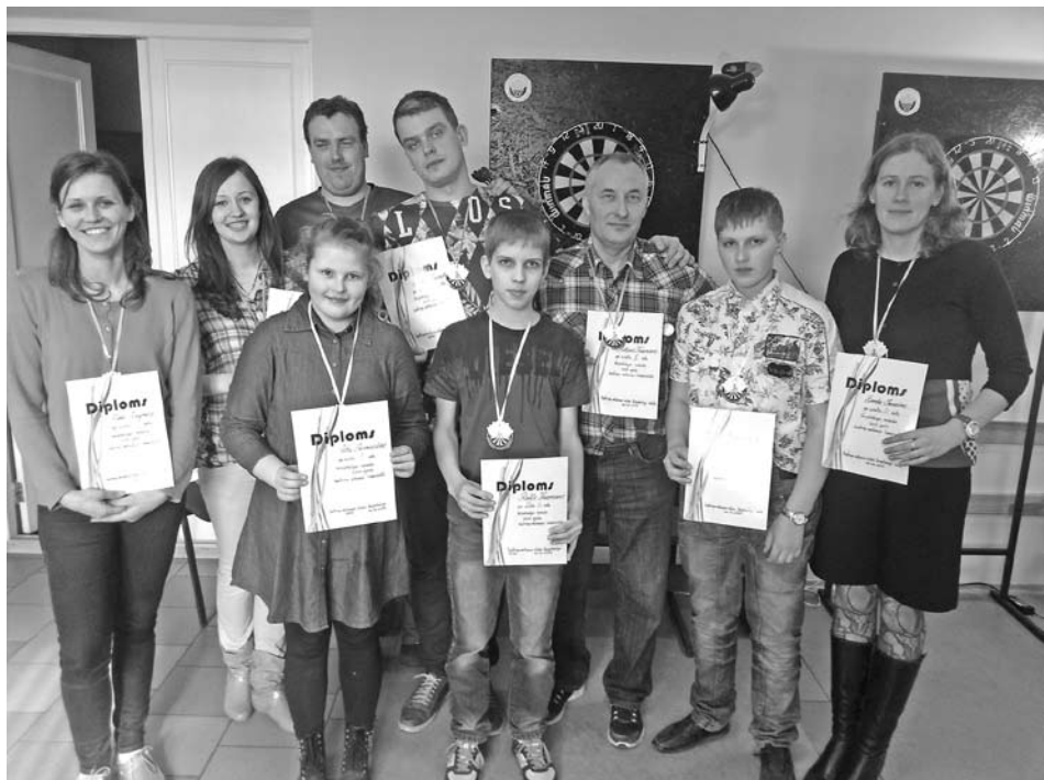
Vecpiebalgas novada čempionāta šautriņmešanā uzvarētāji.

Otrajās Lieldienās norisinājās Vecpiebalgas novada čempionāts šautriņu mešanā. Lai gan pasākums tika reklamēts novada avīzē un mājaslapā, piedalījās dalībnieki tikai no Inešiem un Vecpiebalgas. Priecē, ka bija ieradusies un sacensībās aktīvi piedalījās četri jaunieši.