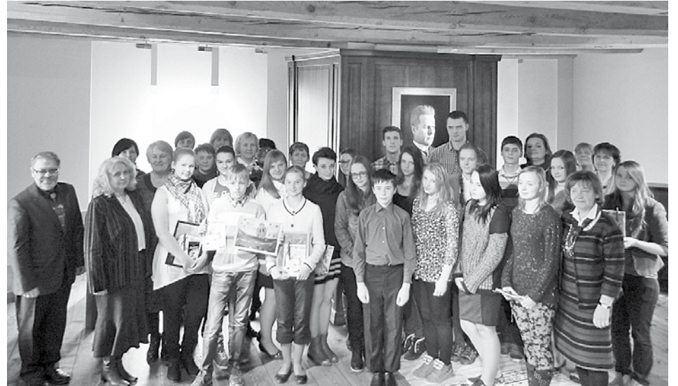
Inešnieki J. Sudrabkalnam vēltīta konkursa noslēgumā „Jānaskolā” kopā ar Vecpiebalgas novada izglītības iestāžu skolēniem un pedagogiem.

Pēc lielās olu ēšanas un sparīgās šūpošanās Liendienās Inešu bērni atgriezās skolā apmierināti un rosīgi, lai sparīgi uzsāktu pēdējo mācību celienu.