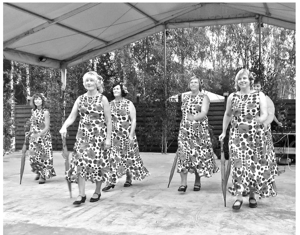
Deju kolektīvs no Taurenes „Pavasara sapņi”.