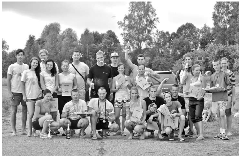
Veiklākie, ātrākie, trāpīgākie!

Atvadoties no vasaras, bērnu un jauniešu centrs „DARI VARI” 9. augustā Taurenes lidlaukā organizēja sporta spēles „Saliedēsim paaudzes!”, kas visas dienas garumā mūs saliedēja gan burtiskā, gan pārnēstā nozīmē. Sporta spēlēs piedalījās 5 komandas un 39 individuāli dalībnieki. Mēs, organizētāji, bijām cerējuši uz lielāku atsaucību, bet, iespējams, laika apstākļi darīja savu.