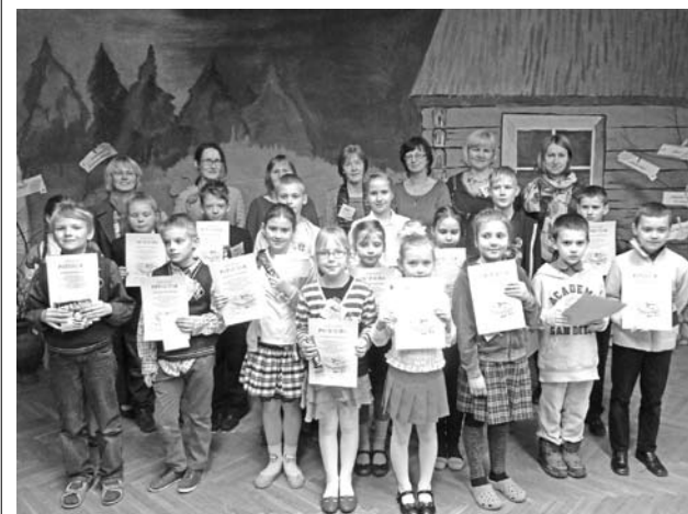
Pētniecisko darbu autori un skolotājas.

6. martā, otro gadu pēc kārtas, Taurenas pamatskolā pulcējās Vecpiebalgas novada sākumskolu skolēni pētniecības konferencē „Mazs cinītis gāž lielu vezumu”, lai pilnveidotu prasmes un atbildētu uz jautājumiem, kopīgi atpūstos un iepazītos ar jauniem draugiem.