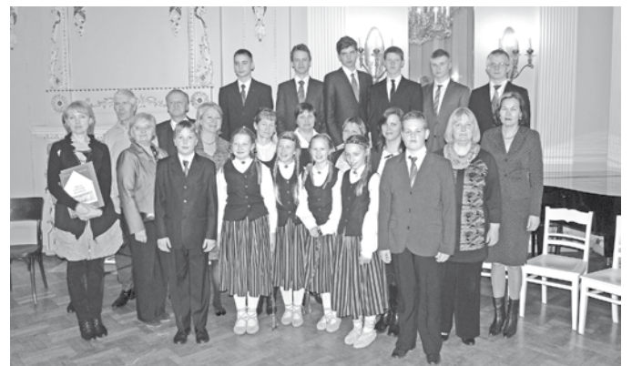
Vecpiebaldzēni sarīkojumā „Masīvais prozaīķis, varens dzīrotājs” Rīgā.