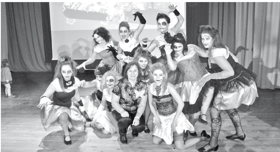
Vecpiebalgas modes deju grupas „Krelles” pārvērtības.