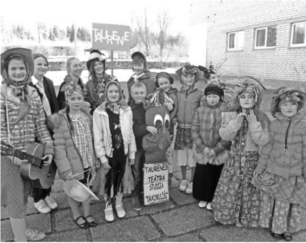
Teātra pulciņš „Draiskulīši” ceļā uz teātru festivālu Liepā.