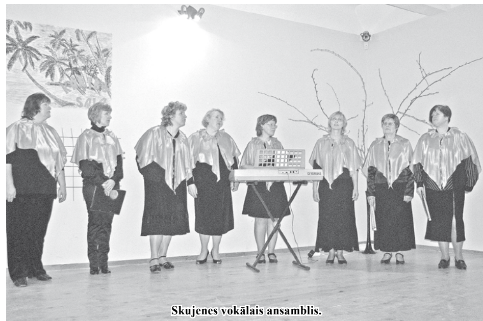
Skujenes vokālais ansamblis.