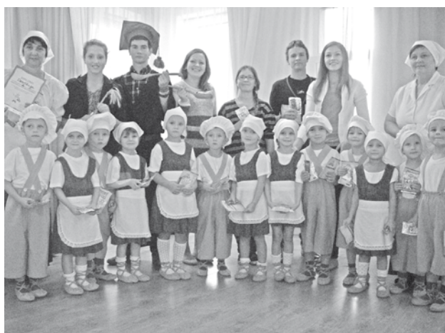
Stingrā žūrija ar Putras konkursa 2. vietas ieguvējiem – „Dzeniņu skolas” grupiņu.

Saņemot uzaicinājumu piedalīties Putras programmā, nešaubījāmies ne mirkli: jāpiedalās! Ar prieku saņēmām ziņu, ka esam iekļuvuši pirmajā simtniekā, kuri pieteikušies visātrāk, tāpēc varēsīm saņemt balvas no „Rīgas Dzirnānieka”. Tad nu bija jāķeras pie darba! Katra klase un bērnu dārza grupiņa darīja, ko varēja: mazākie izspēlēja lomu sižeta rotaļas ar lellēm, klāja galdus, devās uz kafējnīcu „Laura”, lai mācītos pasūtīt ēdienu, samaksāt par to un baudīt pavāru īpaši mums pagatavoto gardo putru, skatījās un mācījās par to, kā top putra. Lielākie paši gatavoja un degustēja, nosakot gardāko.