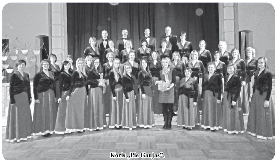
Koris „Pie Gaujas”.