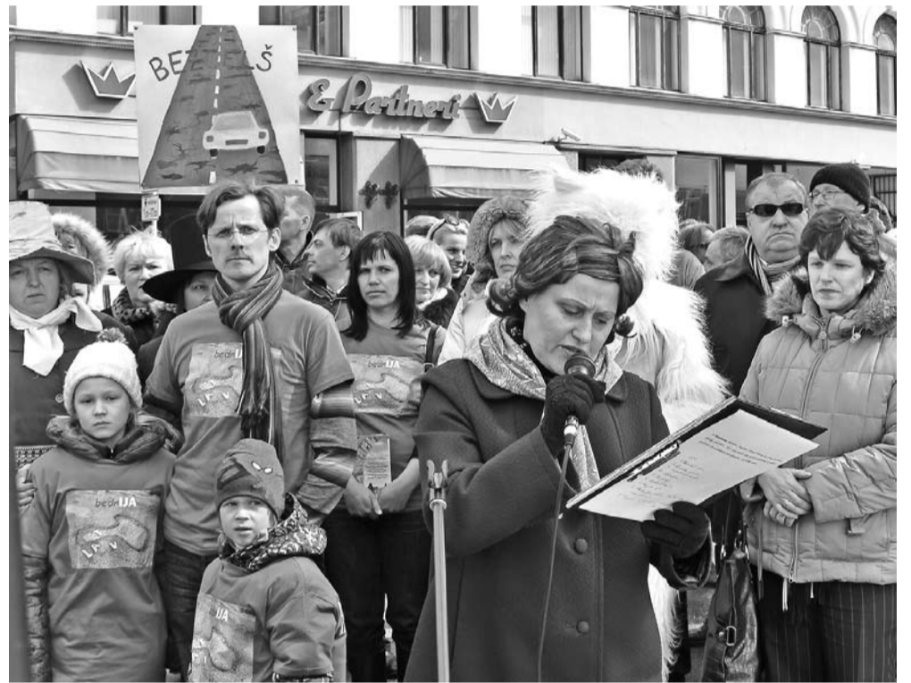
10.aprīlī pēc domes ārkārtas sēdes, biedrības „Piebalgas attīstībai” aicināti, vairāk nekā simts novada iedzīvotāju devās uz Rīgu, lai pie Ministru kabineta aicinātu valdību steidzami risināt sabrukušā ceļa jautājumu.

Vecpiebalgas novada pašvaldība uzskata, ka problēmas ir ar visu Latvijas ceļu apsaimniekošanas plānošanu, uzturēšanu, remontiem, rekonstrukcijas un būvniecības darbu kvalitātes kontroli. Mūsu novada iedzīvotāju aktivitāšu mērķis nav tikai krīzes situācijas novēršana valsts autoceļā P30, bet panākt, lai Satiksmes ministrija kardināli mainītu pašreizējo ceļu apsaimniekošanas politiku, ko drīzāk varētu saukt par bezceļu politiku. Prioritātei ir jābūt esošo ceļu uzturēšana un kvalitatīva atjaunošana. Jāpanāk, lai ceļš pēc rekonstrukcijas nebūtu jāremontē jau pēc dažiem gadiem. Piemēram, ceļa posma Vecpiebalga – Jaunpiebalga rekonstrukciju pabeidza pirms diviem gadiem, bet jau tagad tas ir kritiskā stāvoklī. Tas pats ir ar pirms septiņiem gadiem rekonstruēto ceļa P30 posmu no Bērzkroga līdz Meļļiem. Tāda sajūta, ka valsts ber simtiem miljonu caurā maisā un nevienam par to nav jāatbild.