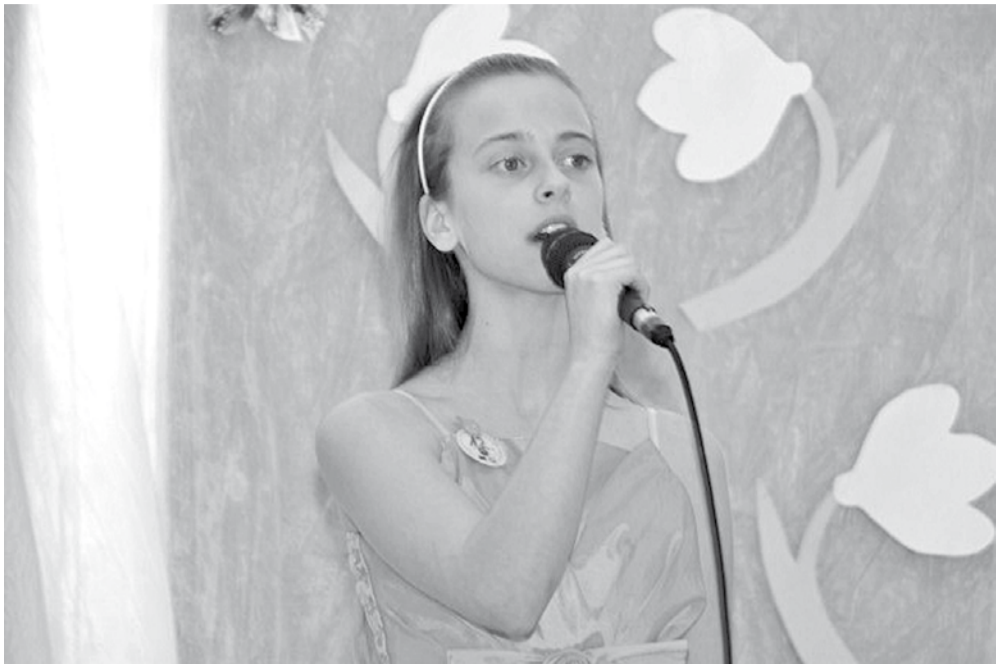
Galvenās balvas ieguvēja.