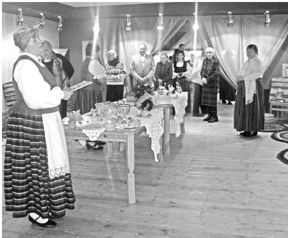
Izstādes atklāšanā tautas nama vadītāja pateicības vārdus vēltēja novada cilvēkiem, ar kuru amata prasmēm varam pamatot lepnoties.