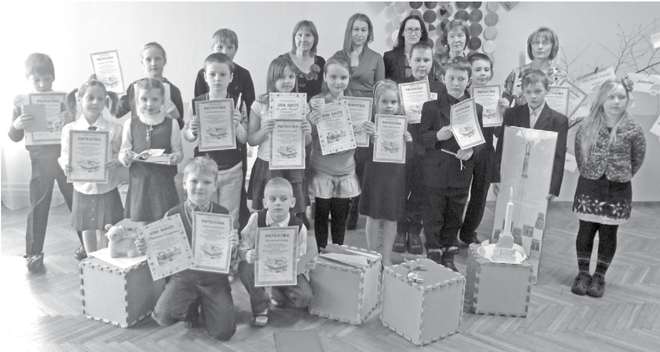
Novada skolu pārstāvji Mazajā pētniecības konferencē Taurenē.