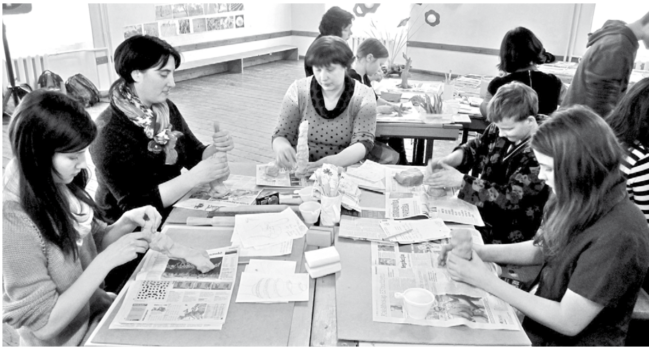
Tēlniecības darbnīcā „Dziesmu svētku ceļš” cītīgi darbojas gan skolēni, gan pedagogi.

19. martā pēcpusdienā Inešu pamatskolā rosīgi darbojās Dzērbenes, Inešu, Skujenes, Tauresnes un Vecpiebalgas skolas mazie mākslinieki, viņu skolotāji un citi interesenti, kā arī Jaunpiebalgas novada keramiķi, lai kopīgā darbā izveidotu Piebalgas ekspozīcijas vietu Dziesmu svētku ceļā. Izstāde būs aplūkojama svētku laikā Rīgā, galerijā „Centrs”.