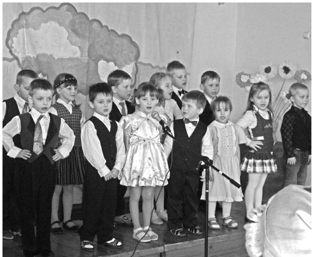
Dzērbenes bērnu darza 13. martā tika piecīvināts un pieskandināts ar Mazo un Lielo “cāļu” nīprajām balstiņām.