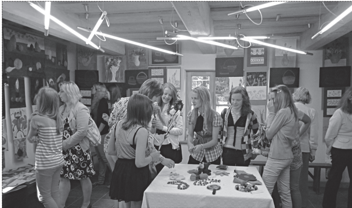
Radošo darbu skate pulcēja gan esošos, gan potenciālos audzēkņus un viņu vecākus.