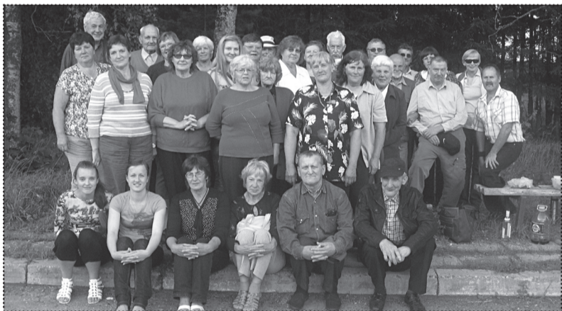
Taurenes pensionāri gandarīti, jo ekskursija uz Latgali ienesa patikamu pārmaiņu viņu ikdienā.