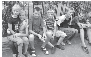
Jaunie biatlonisti pēc Botāniskā dārza apmeklējuma.