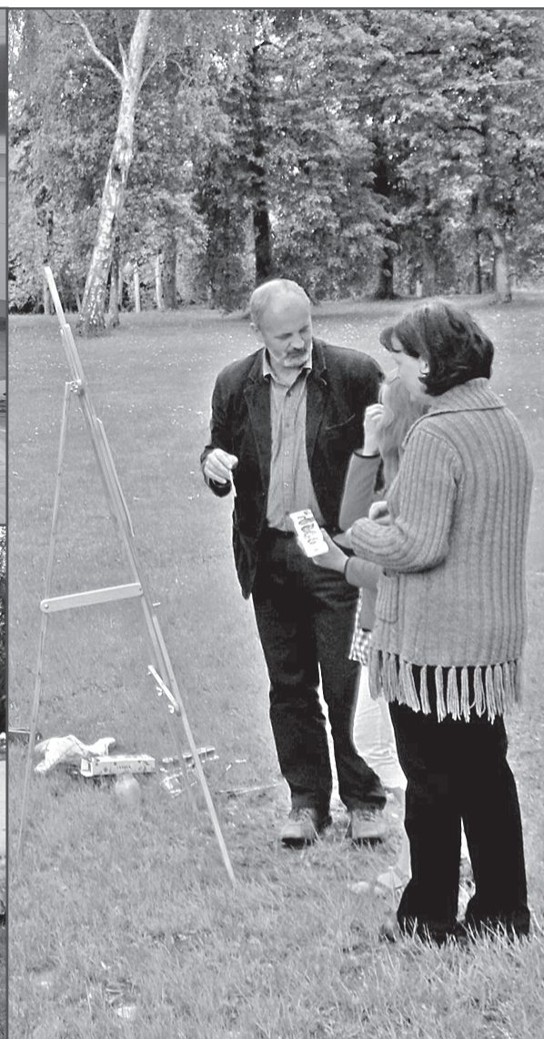
Mākslas skolas audzēkņi plenēros.