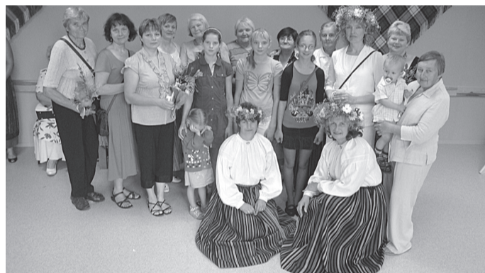
Vecpiebalgas audējas izstādes atklāšana.