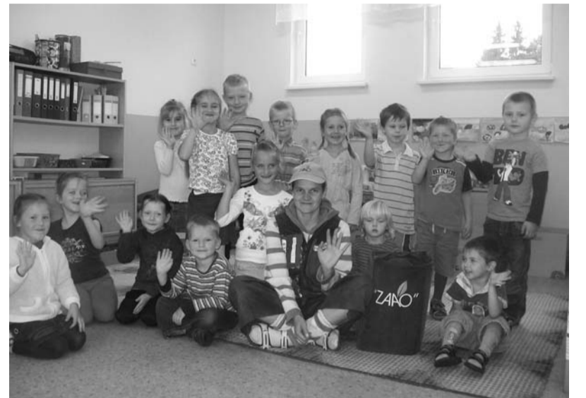
Taurenes bērnudārza kolektīvs aktīvi iesaistās ZAAO aktivitātēs