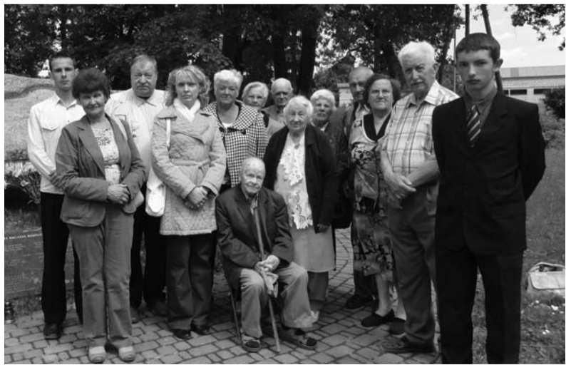
Cilvēki nesteidzās izklist, dalījās atmiņās un pārdzīvojumos. Pie piemiņas akmens sarkanā terora upuriem gulās ziedi.