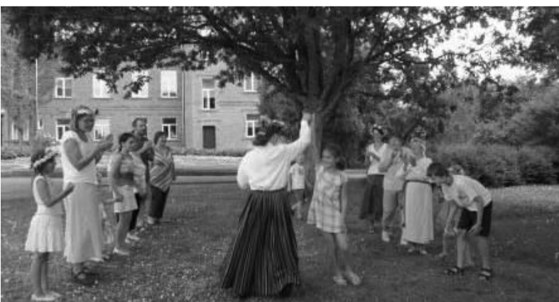
Dzērbenē mācās Jāņu tradīcijas.