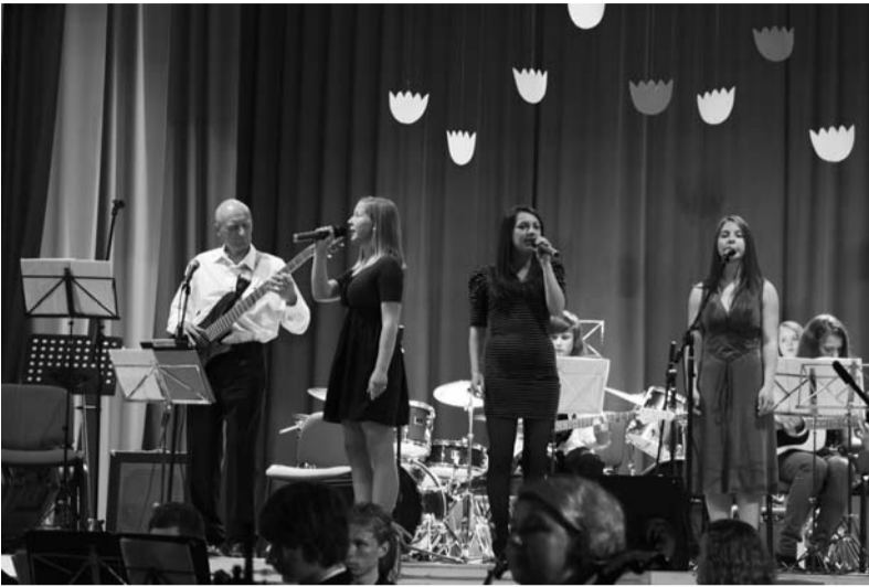
Jaunie talanti muzicē Vecpiebalgā.