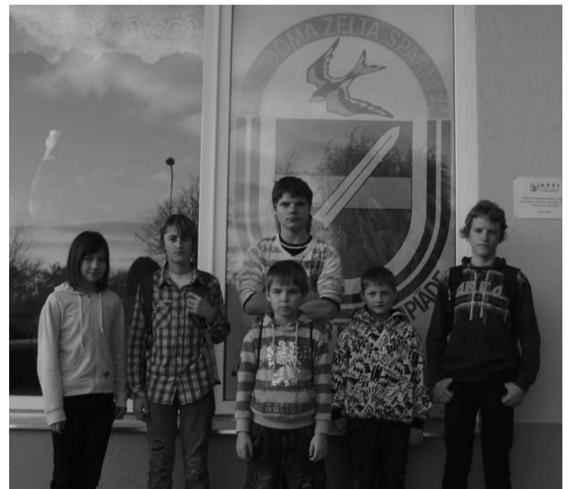
Taurenes pamatskolas talantīgākie matemātiķi.