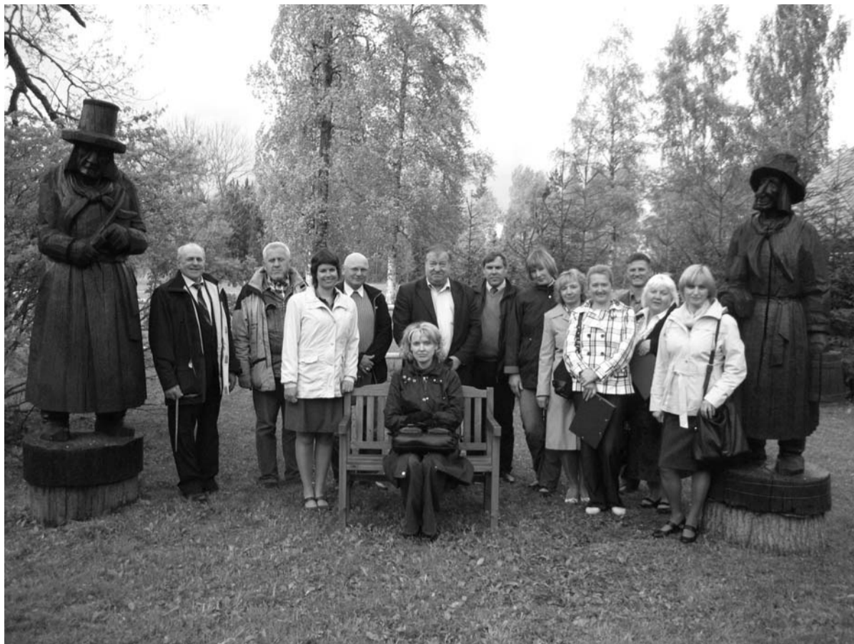
Deputāti un domes darbinieki izbraukuma sēdē „Kalna Kaibēnos”.

– Pašlaik, lūkojoties uz uzņēmējdarbības uzsākšanu, jāatzīst, ka šis ir inovāciju laiks – jauni, neordināri risinājumi un piedāvājumi ir uzņēmēju tilts gan pie patērētājiem vietējā, gan eksporta tirgū. Es nedomāju, ka Piebalgā ir vajadzīga kāda liela rūpnīca vai fabrika, man liekas, ka mūsu novads ir mazo un vidējo uzņēmēju dzīves un darbavietas. Mūsu lielākā vērtība ir skaistā daba un kultūrvēsturiskais mantojums. Katrs tūrists, kurš apmeklē novadu, dod savu artavu arī biznesa cilvēku maciņos. Mazsvarīgs nav arī apstāklis, ka mēs esam ļoti atvērti dialogam. Uzņēmējam tāpat kā jebkuram iedzīvotājam ir svarīgi, lai ikvienu problēmu varētu risināt tad, kad tā ir, neskatoties uz pieņemamajiem laikiem vai konkrētām tikšanās reizēm. Mēs esam pietiekami maza pašvaldība, lai visus jautājumus varētu risināt operatīvi.