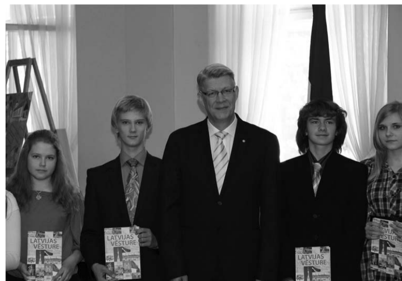
Vēstures pētniecisko darbu konkursa “Vēsture ap mums” laureāti. Kopā ar Valdi Zatleru.

Paldies pašvaldībai par izpratni un atbalstu, īstenojot radošās aktivitātes!