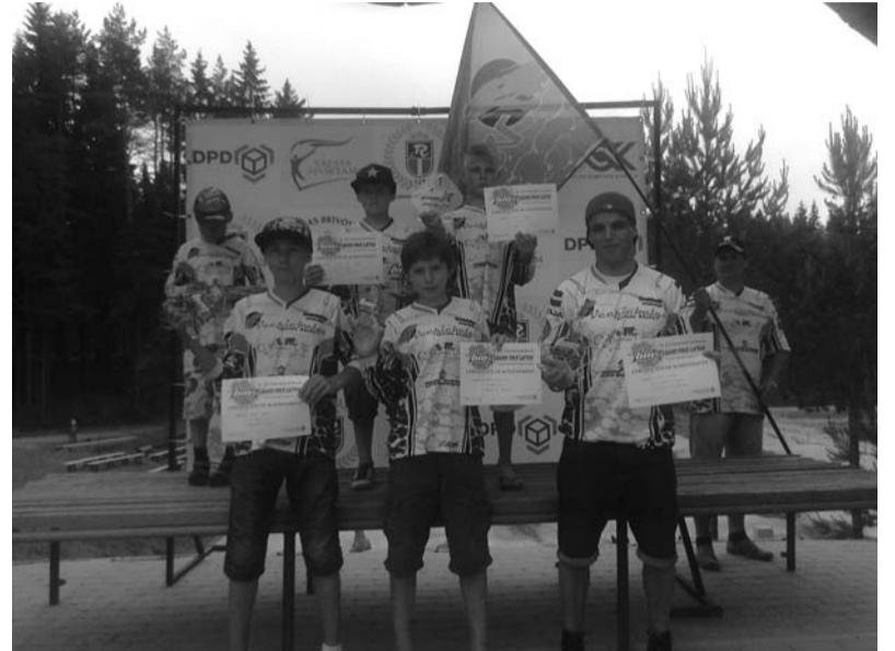
Mūsu novada jaunie censoņi. Apsveicam!

Rīgas riteņbraukšanas federācija klubam „Vecpiebalga” ir uzdāvinājusi divus BMX velosipēdus mazajiem braucējiem – iesācējiem. Jaunieģi velosipēdi gaida mazos talantus, kas vēlētos piebiedroties jau esošo braucēju pulkam.