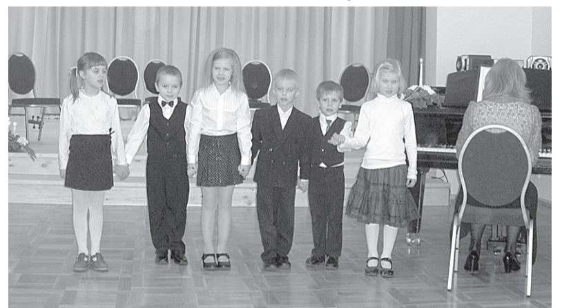
Mazo dzērbeniešu paldies!