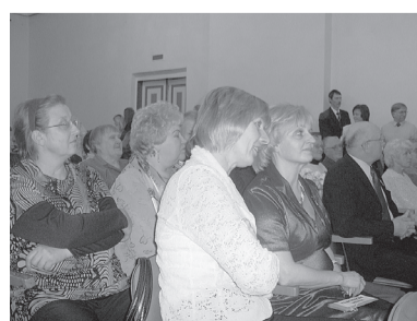
Pasākums pulcēja kuplu dalībnieku pulku.