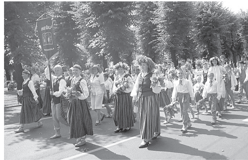
Inešu pamatskolas kolektīvi dziesmu un deju svētkos lepnī par savu skolu un pagastu.