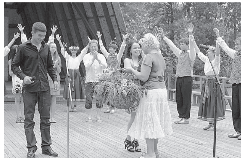
Ziedi un skatītāju ovācijas māksliniekiem.

Paldies visiem tiem, kas apmeklēja šo burvīgo koncertu, kā arī gaidīsim ikvienu uz nākamajiem pasākumiem Taurenē, arī turpmāk pārsteigsim un priecēsim ar dažādām kultūras aktivitātēm.”