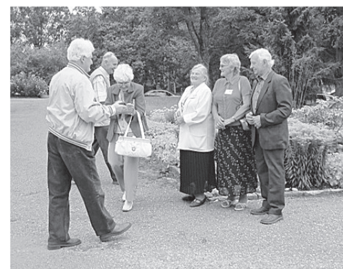
Kad gadiem es pāri skatos...