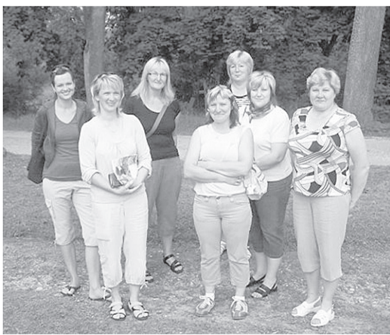
Sieviešu klubīnā „Zīle” dalībnieces gandarītas par nometnē pavadīto laiku.