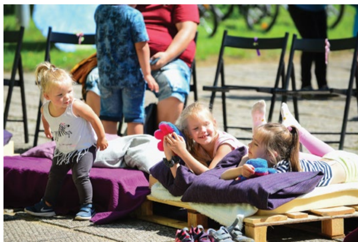
Attēlā: Liepas kopienas pērn rīkotie Liepas vārda dienas svētki bija notikumiem bagāti gan lieliem, gan maziem liepēniešiem.