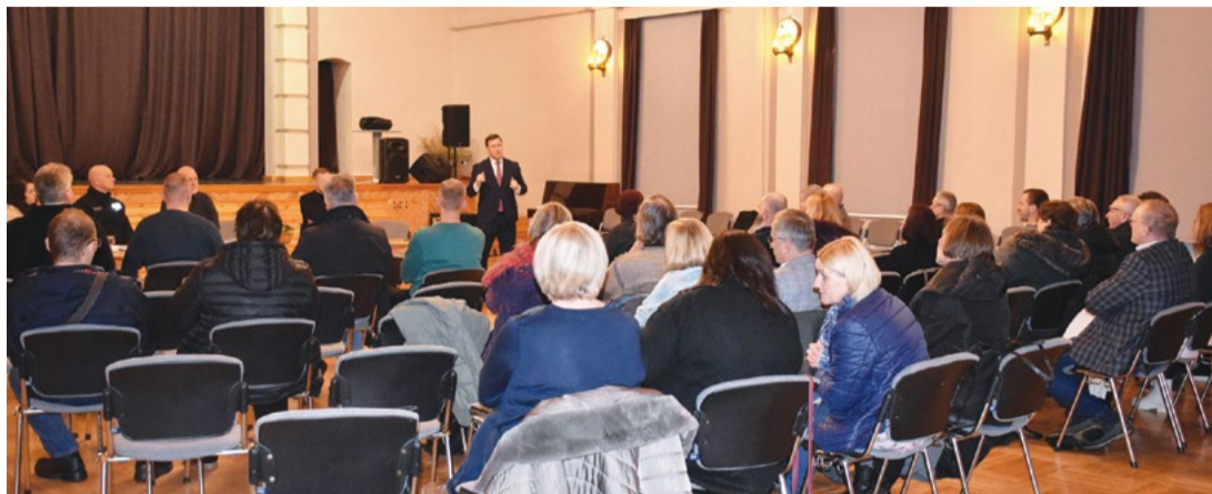
Attēlā: Tikšanās reizē ar pašvaldības vadību vecpiebaldzēni aktīvi interesējās par ceļu sakārtošanu pagastu teritorijā, saimnieciskajiem darbiem centrā un arī izglītības jautājumiem.

Priekšsēdētājs ieskicēja, kādās jomās veidosies lielākais budžeta izdevumu pieaugums, salīdzinot ar pagājušo gadu – izglītība, tai skaitā, algu pieaugums pedagogiem un skolēnu