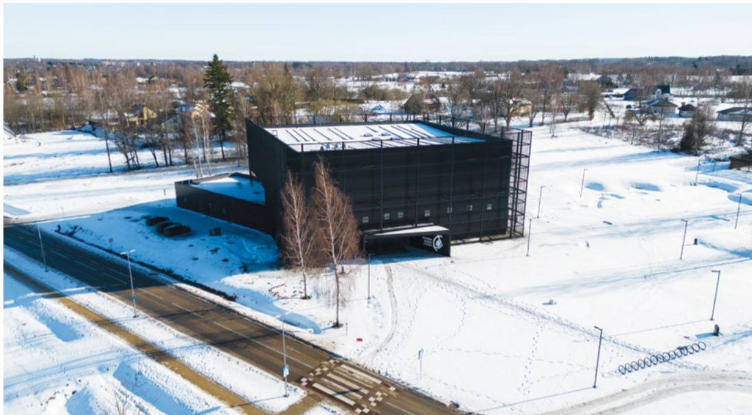
Attēlā: Ēkas būvniecība ir pabeigta, notiek iekšējumu apgūšana un ekspozīcijas veidošana, lai šovasar, jūlijā, Kosmosa izziņas centrs vērtu durvis apmeklētājiem.

Ēka projektēta ar zemu enerģijas patēriņu (15 kWh/m2 gadā), un galvenais siltumnesējs ir siltumsūknis ar kopējo jaudu 70 kW. Siltā ūdens ražošanai uzstādīti divi granulu apkures katli ar kopējo jaudu 120 kW. Blakus namam izbūvētas pazemes tvertnes, kurās attīrīs uz ēkas jumta sakrāto lietotus ūdeni, lai pēc tam to padotu otrreizējai izmantošanai. Uz jumta uzstādīti arī saules paneļi, kas nodrošinās pietiekami elektrības visām izziņas centra vajadzībām.