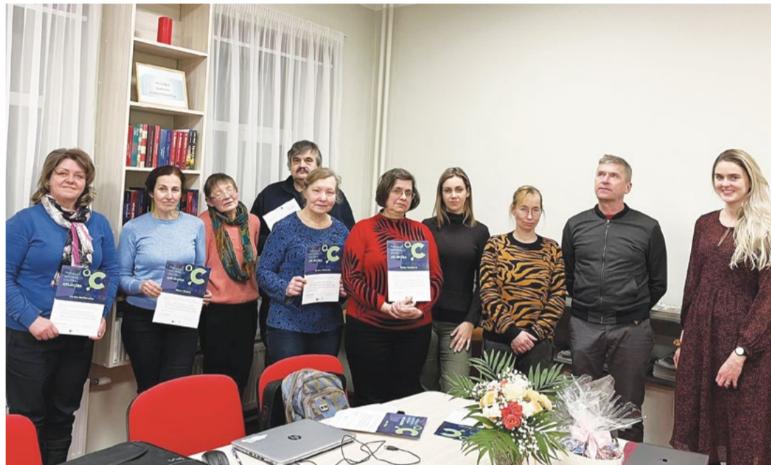
Attēlā: Digitālās prasmes vēlas apgūt ne tikai Vecpiebalgā. Martā sāksies jauns apmācību cikls visā novadā. Interese ir liela un visas grupas jau ir nokomplektētas

Februāra vidū noslēdzās Cēsu Digitālā centra apmācības "Digitālās pamatprasmes"