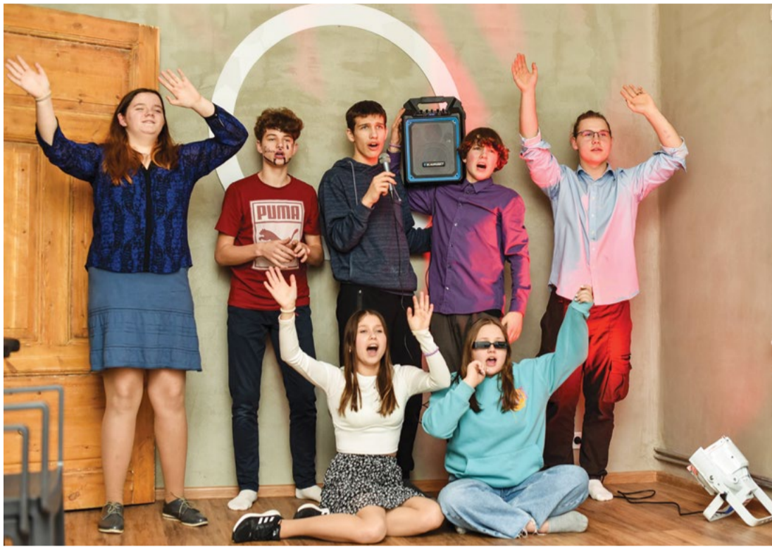
Attēlā: Telpu atklāšanas svinībās Līgatnes jaunieši iepriecināja viesus ar atraktīviem priekšnesumiem.